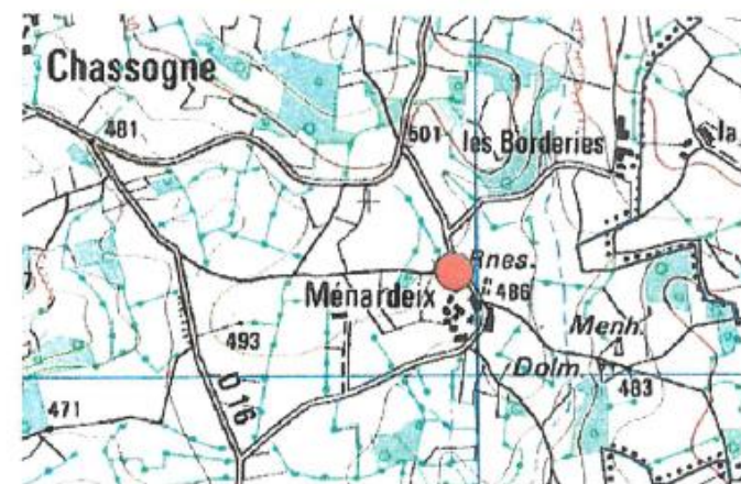
● IGN - Saut23

Observations : Laurent RIVIERE - O.N.F. - novembre 2005