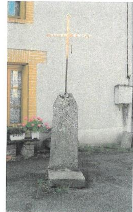
● O.N.F. - Laurent RIVIERE

Intérêt : La croix est située dans le Bourg. Intérêt culturel et touristique car la croix est sur le circuit de Pionnat-Bosgenet.