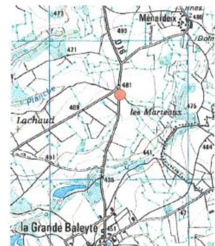
● IGN - Scand 5

Observations : Laurent RIVIERE - O.N.F. - novembre 2005