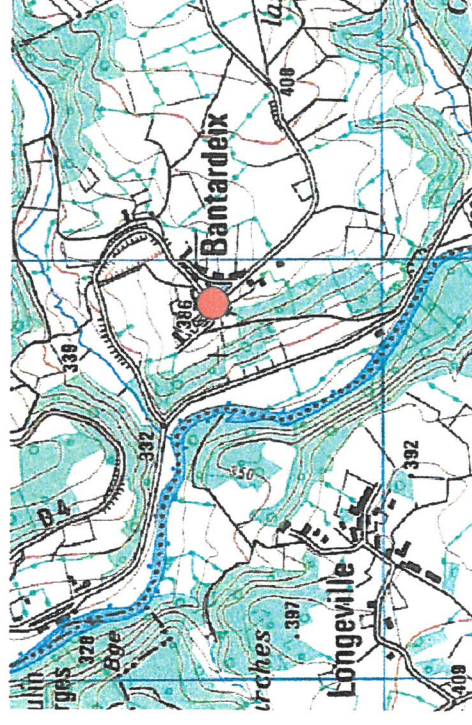
● IGN - Scan25

Observations : Laurent RIVIERE - O.N.F. - novembre 2005