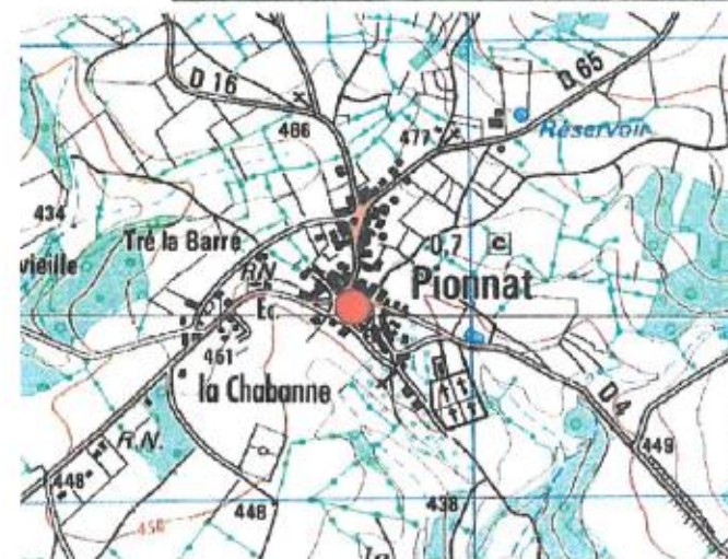
● IGN - Soudis

Observations : Laurent RIVIERE - O.N.F. - novembre 2005